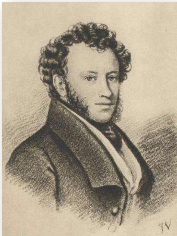
Пушкин Александр Сергеевич (1799–1837)