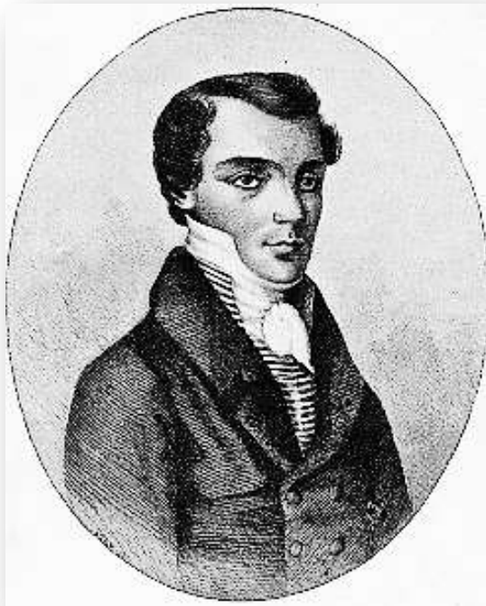
Рылеев Кондратий Федорович (1795–1826)

– поэт, общественный деятель, декабрист, казнен в 1826 г.