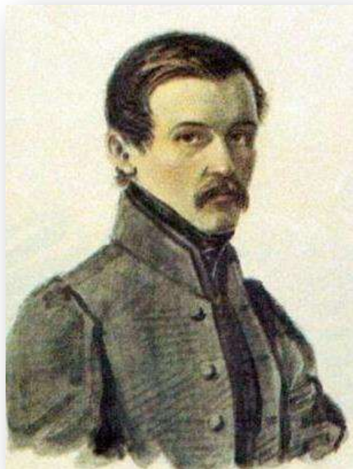
Басаргин Николай Васильевич (1799 –1861) – декабрист, мемуарист, публицист

«Записки Николая Васильевича Басаргина» – воспоминания декабриста были написаны в 1856 г. Охватывают период с 1819 по 1848 гг. В них содержатся сведения о Тульчинском обществе и Союзе Благоденствия, о смотре войск в Тульчине, рассуждения о причине возникновения тайных обществ в России и декабрьского восстания 1825 г.; дана оценка международной обстановке на тот период; освещены жизнь в Сибири и на поселении после каторги.