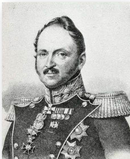
Евгений Александрович Головин (1782–1858)

«Очерк жизни и службы Е. А. Головина» посвящен ратным подвигам Евгения Александровича Головина – генерала от инфантерии, генерал-адъютанта русской императорской армии.