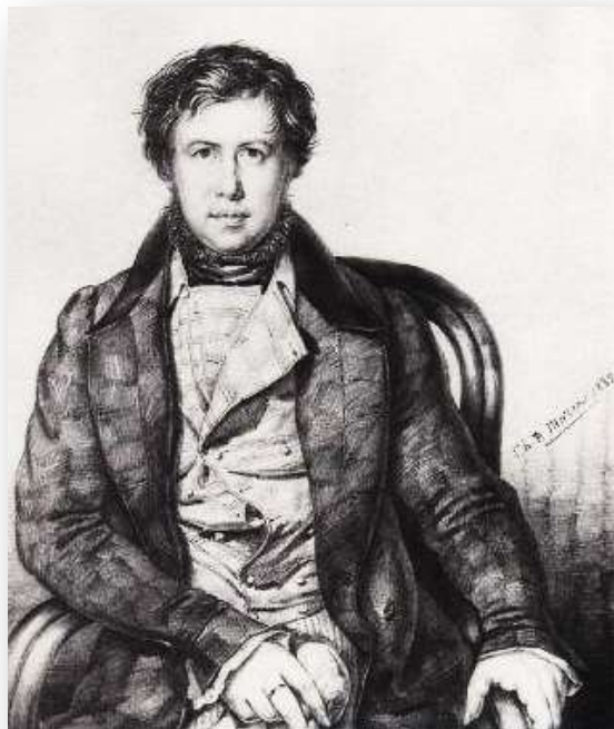
Нашокин Павел Воинович (1801–1854)

– русский меценат, коллекционер, близкий друг А.С. Пушкина