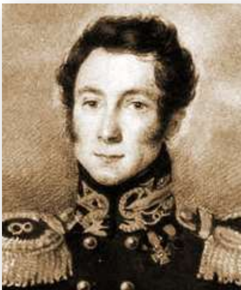
Бестужев Николай Александрович (1791–1855)

– капитан-лейтенант 8-го флотского экипажа, декабрист, историограф флота, писатель, критик, изобретатель, художник